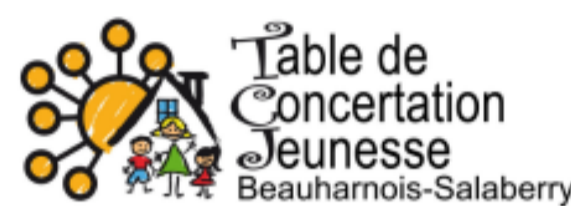
Table de concertation jeunesse